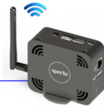
BC v.6 - AMBIENTAL