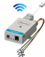
DMW PORTA ABERTA