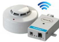
DMW AMBIENTAL 2 (temperatura, umidade e fumaça)